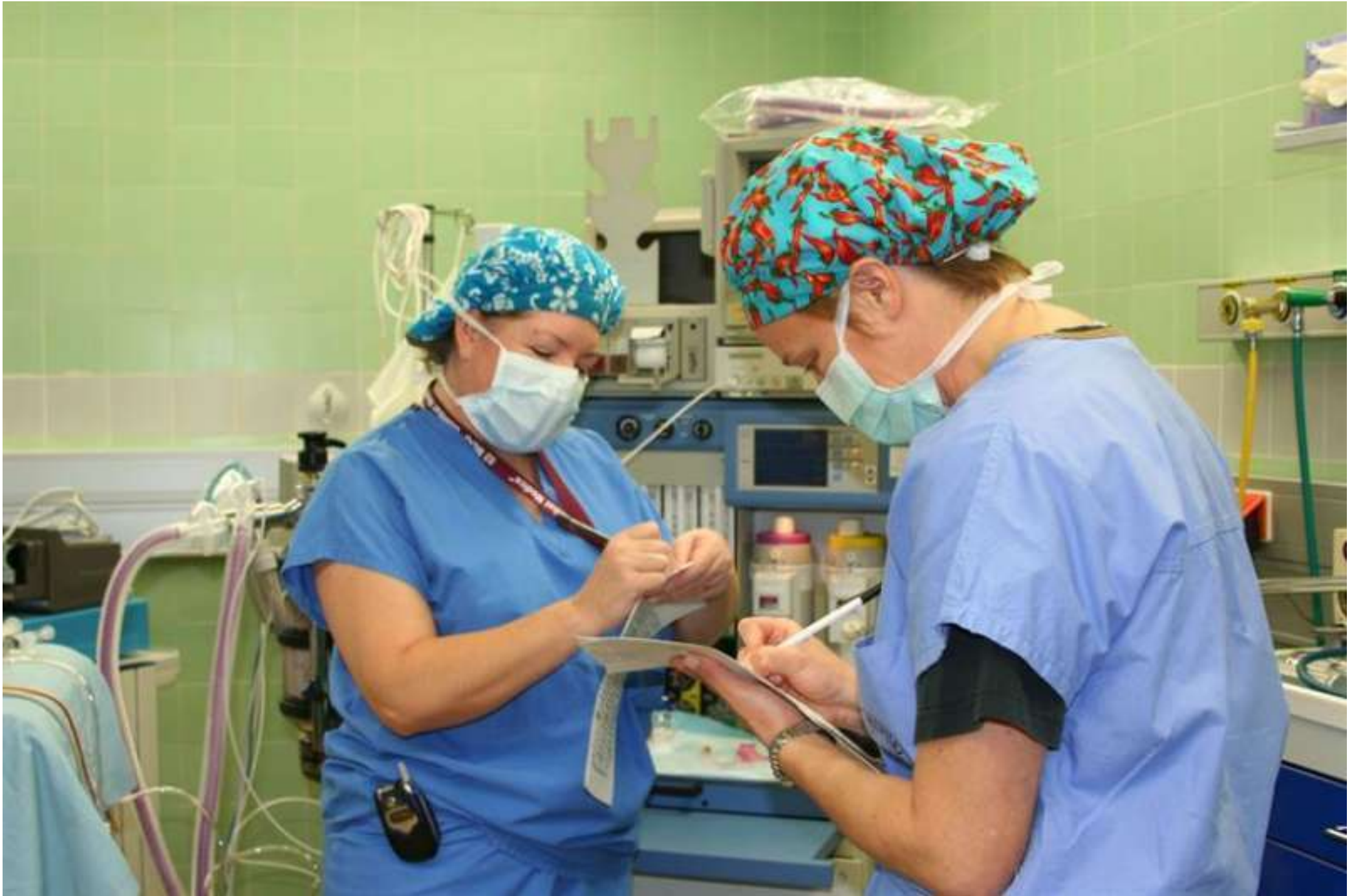
Dos enfermeras en su turno.